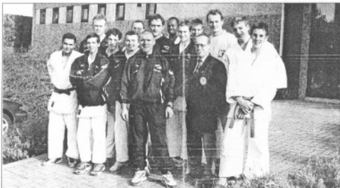
Le Tori Beauvechain dispose d'une équipe qui a fière allure. Elle est prête à jouer les premiers rôles dans ce championnat. BHO38159