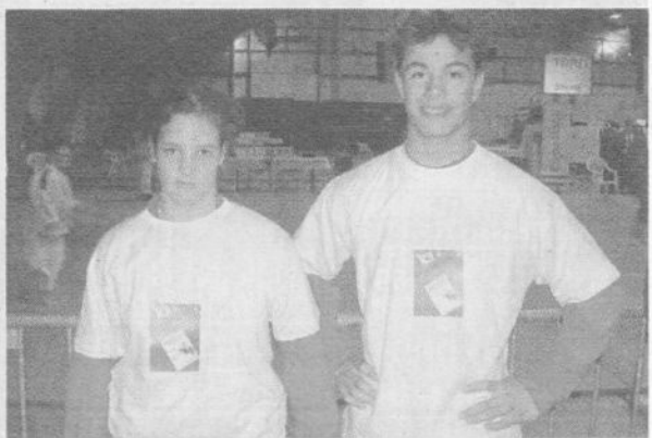
Les deux champions du club.

Les entraînements ont lieu les mardis de 20 à 21h30 (compétitions pour les plus de 12 ans) les mercredis de 17 à 18h (baby-judo), de 19h15 à 19h45 (technique pour les 7 à 12 ans), de 20 à 21h30 (à partir de 12 ans), les vendredis de 19 à 20h (compétition de 7 à 12 ans) et de 20 à 21h30 (plus de 12 ans) et les samedis de 9h30 à 10h30 (5 ans 1/2 à 7 ans) et 10h30 à 12h (tech-